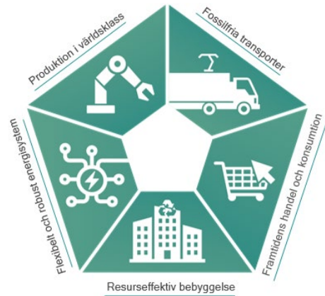
Figur 2 Energimyndighetens nationella sektorstrategier

Under året har Fastighetsnätverket fortsatt utgjort en av Sveriges strateginoder med koppling till Energimyndighetens nationella sektorstrategier. Därigenom vill Fastighetsnätverket bidra till att uppnå nationella klimatmål. Framförallt bidrar Fastighetsnätverket till framfart inom sektorerna ”Resurseffektiv bebyggelse” och ”Flexibelt och robust energisystem”. Strateginoden ska främja en helhetssyn i energianvändningen och gynna en framtida utveckling av resurseffektiv bebyggelse i samspel med lokala energisystemlösningar.