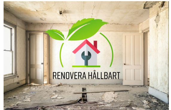
Figur 4 "Energirenovering - samverkansprojekt med LÅGAN

Kallelser, program, nyheter och dokumentation från nätverksträffar har löpande lagts upp på Fastighetsnätverkets webbplats som förvaltas av Region Örebro län.