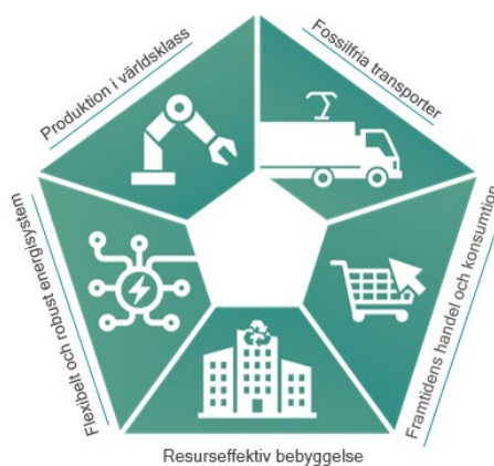
Figur 2 Energimyndighetens nationella sektorsstrategier

Därigenom vill Fastighetsnätverket bidra till att uppnå nationella klimatmål. Framför allt bidrar Fastighetsnätverket till framfart inom sektorerna ”Resurseffektiv bebyggelse” och ”Flexibelt och robust energisystem”. Strateginoden ska främja en helhetssyn i energianvändningen och gynna en framtida utveckling av resurseffektiv bebyggelse i samspel med lokala energisystemlösningar.