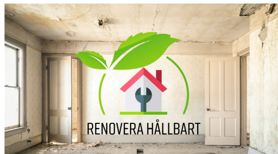
Figur 4 Goda exempel på energiuppföljning - samverkansprojekt med LÅGAN

Under 2023 har Fastighetsnätverket fortsatt utgjort en av nio nationella nätverk som ingår i LÅGAN. LÅGAN är en nationell samarbetsplattform som drivs av Sveriges Byggindustrier med ekonomiskt stöd från Energimyndigheten. Övergripande syfte är att genom samarbetsplattformen utveckla kunskaper byggande och renovering av lågenergibyggnader och på så sätt driva utvecklingen framåt.